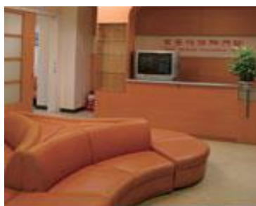
台北醫學大學萬芳區醫學中心溫馨的健診環境。

就醫療品質與費用而言，遊客到境外診療，享受的是國際級品質，花費卻是相當實惠，例如準分子雷射手術台灣與日本價差就高達2倍，在台接受醫療所省下的額度，其實就等於支付來回機票與旅遊花費。效率而言，中國大陸位於亞洲中心，亞洲國家平均4小時可以抵達，搭配合理的醫療價格及高水準的醫療團隊，兩岸可望成為繼新加坡、泰國後，吸引全球觀光客接受觀光醫療服務的首選。